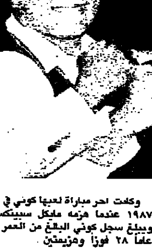
وكانت احرم مباراة لعبها كوني في عام ١٩٨٧ عندما هزمه مايك تايسون ويبلغ سجل كوني البالغ من العمر ٣٣ عاماً ٢٨ فوزاً وهزيمتين.

قال الاميركي جورج فورمان بلال العالم الملاكمة في الالوة الاخيرة الذي عد الى الحلبة وعصره ٤١ عاماً له رفض عرضاً للعب امام مواطنه مايك تايسون بطل العالم. وقال فورمان ان في هوسون حيث يقام المباراة التي يلعبها في ١٥ كانون الثاني الحالي بميدان الملاكمة ستبي مع مواطنه جيري كوني وسوف يحصل منها على مليون دولار. وقال فورمان انه رفض ذلك لان الاتقاق لا يشمل لما من التخمين الذين عملوا معه بعد عودته عام ١٩٨٧ عقب ابتعاد عن الحلبة عشرة اعوام. وكان فورمان قد اتزاع لقب بطولة العالم من جوج فرينز عام ١٩٧٣ ثم خسره امام محمد علي في العام التالي. فاز عونه الى الحلبة لعب ١٩ مباراة منذ بدأها جميعها واصبح سجله الاجمالي ٦٤ فوزاً وهزيمتين.